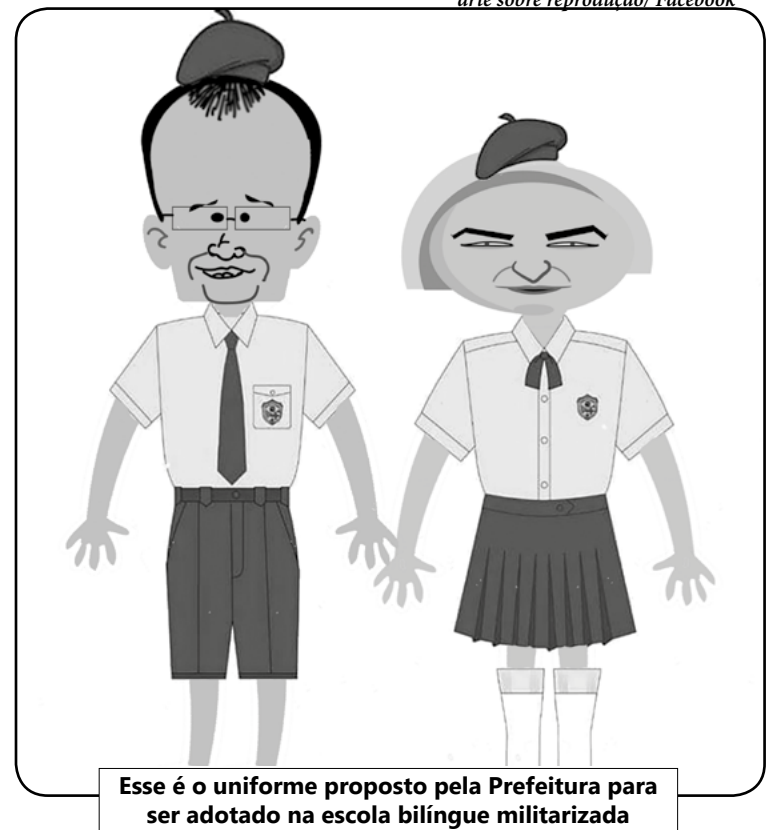
Esse é o uniforme proposto pela Prefeitura para ser adotado na escola bilíngue militarizada

Precisamos de ideias que atendam às necessidades reais e por ordem de urgência. Até porque, se continuarmos com a falta de diálogo entre a população e o governo, no futuro só teremos demanda para esse tipo de “profissionais” abaixo: