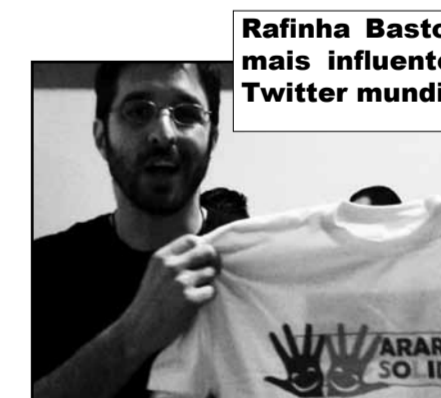
Rafinha Bastos, o mais influente do Twitter mundial