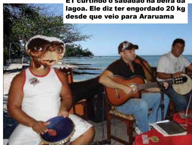
ET curtindo o sabadão na beira da lagoa. Ele diz ter engordado 20 kg desde que veio para Araruama

do pra ver qualé. Mas aí, ano que vem, não esqueça: Pra Araruama se desenvolver, vote em ET!