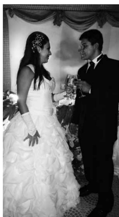
Quem pensa que vida de empresário é moleza, tá... hora extra no fim-de-semana