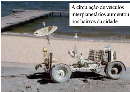
A circulação de veículos interplanetários aumentou nos bairros da cidade

Os novos veranistas que passaram a frequentar a cidade desde a construção do Aeroporto Espacial não gostaram da experiência de trafegar pelas ruas dos bairros. "Nem as crateras da Lua chegam aos pés dessas daqui", reclamam eles.