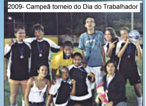
2009- Campeã torneio do Dia do Trabalhador

blogspot.com.br/) - Fico feliz por ela estar jogando no Vasco. É a melhor zagueira Sub-17 do Brasil, uma segurança na defesa. Passa tranquilidade para o time e para a comissão técnica. Terá um futuro brilhante no Futebol. Serve de exemplo para as meninas da base - declarou o treinador. O porte físico da jovem também impressiona a todos que acompanham o futebol feminino. Durante o Sul-Americano, mais precisamente no primeiro jogo do qua-