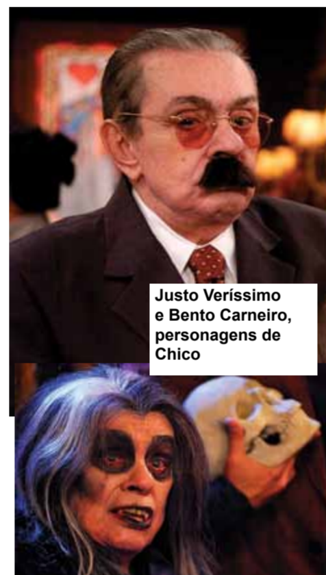
Justo Veríssimo e Bento Carneiro, personagens de Chico

A gente aqui na redação não poderia deixar de prestar um reverência, mesmo que atrasada, ao talento desses dois mestres, não só do humor, quanto de diversas outras áreas correlacionadas. Mesmo sem nunca terem tomado ciência do O CARAPEBA, podem ter certeza que a influência de vocês vai continuar pautando nossos textos e delírios, mesmo que sem chegarmos aos seus pés. Valeu, gente!