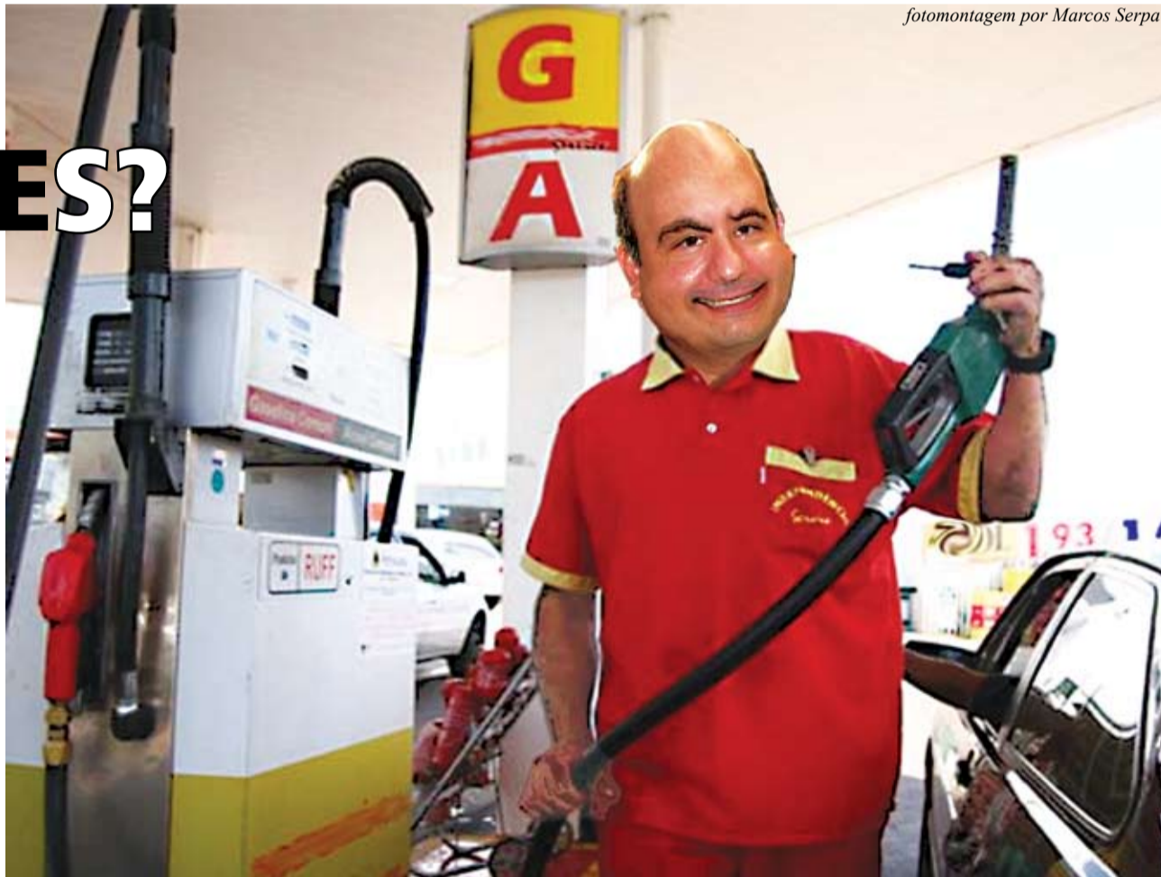
fotomontagem por Marcos Serpa

Como observador que eu me propus ser desde que, em 2003, comecei a colaborar com minhas crônicas políticas para os jornais de Araruama, acredito que nosso município vive hoje o seu momento mais preocupante. Apesar de nossa proximidade com a capital, permanecemos distantes da sua modernidade e riqueza. Com a injeção dos royalties do petróleo, alguns dos nossos vizinhos estão experimentando um crescimento impressionante, o que torna ainda mais evidente o tamanho do nosso atraso. Com uma economia fraca e sem políticas públicas que nos orientem no caminho do futuro, ficamos inteiramente dependentes das minguadas verbas estaduais e federais, e dos comprometimentos político-eleitorais que elas nos acarretam. As nossas autoridades municipais têm por costume enxergar as prioridades dentro de uma ótica de momento, desdenhando quaisquer formas de planejamento que privilegiem o médio e longo prazo. Por conta de tudo isso, a cidade incha ao invés de progredir. Como não existe ordenamento urbano, a favelização, como um câncer, vai progressivamente ampliando os limites da periferia, começando a sufocar nossos bairros. E o resultado aí está. Precisamos cada vez mais de recursos estaduais e federais em saúde e educação, para atender uma demanda que cresce diariamente. Sem turismo ou agropecuária, e com um paraíso fiscal bem ao nosso lado (que torna mais atraente a fixação de empresas em Saquarema, por exemplo) o futuro que se avizinha é, no mínimo, pouco promissor.