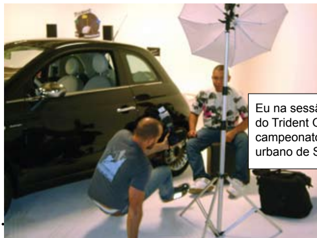
Eu na sessão de fotos do Trident Golf - o 1º campeonato de golfe urbano de São Paulo