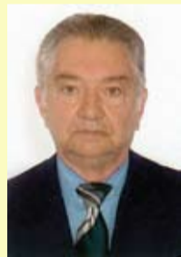
por Léo Anelhe

E para fechar o capítulo das perguntas que nem merecem resposta, aqui vai mais uma: o Partido Verde, que é representado na Câmara pelo vereador Norberto, e que faz parte da base de apoio do prefeito André Mônica, foi quem indicou o secretário municipal do Meio Ambiente?