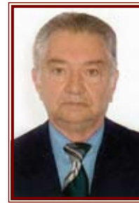
por Léo Anelhe

As colunas e artigos assinados são de inteira responsabilidade de seus autores e não refletem necessariamente a opinião do jornal