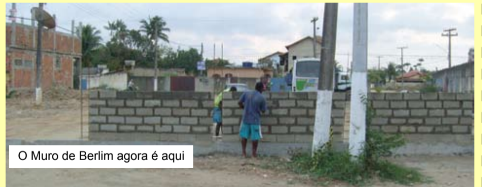
O Muro de Berlim agora é aqui

Realmente, as coisas parecem não andar muito bem para aquelas bandas. Depois de receber o status de mais nova área de risco – por conta das águas da Av. Gladstone de Melo – e da possibilidade do IBGE classificar seus moradores como população flutuante, eis que apareceu um muro no caminho dos moradores. E a gritaria foi tamanha que o prefeito foi até lá, prometendo que vai resolver o problema. E como não é de perder viagem, pediu votos para os seus deputados. E tinha gente que jurou que não era reunião política.