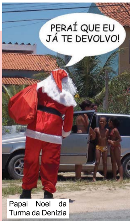
Papai Noel da Turma da Denízia