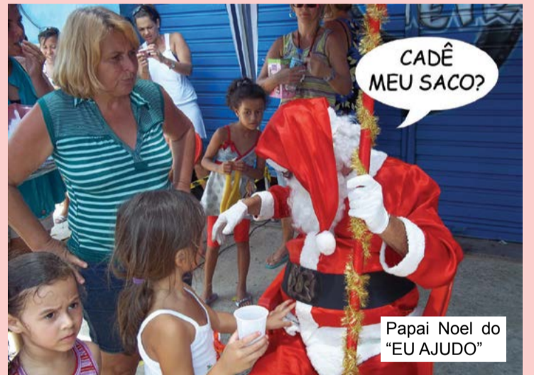
Papai Noel do "EU AJUDO"