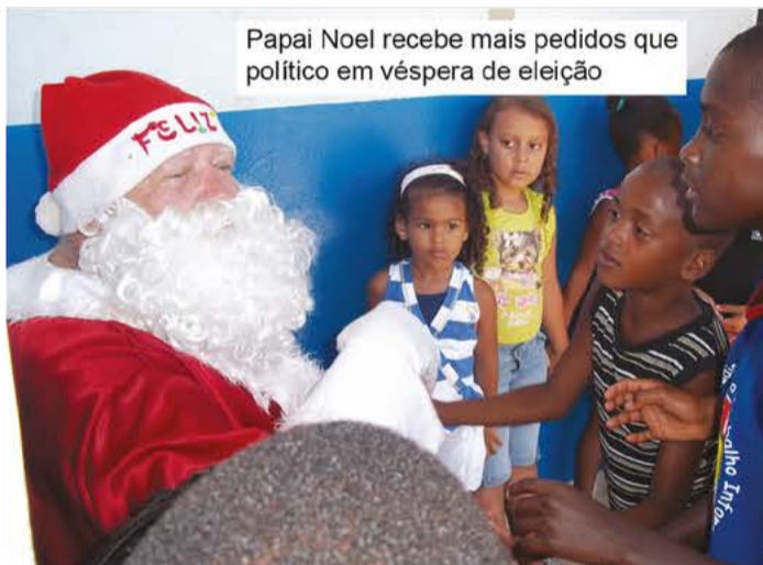
Papai Noel recebe mais pedidos que político em véspera de eleição