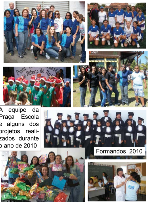
A equipe da Praça Escola e alguns dos projetos realizados durante o ano de 2010