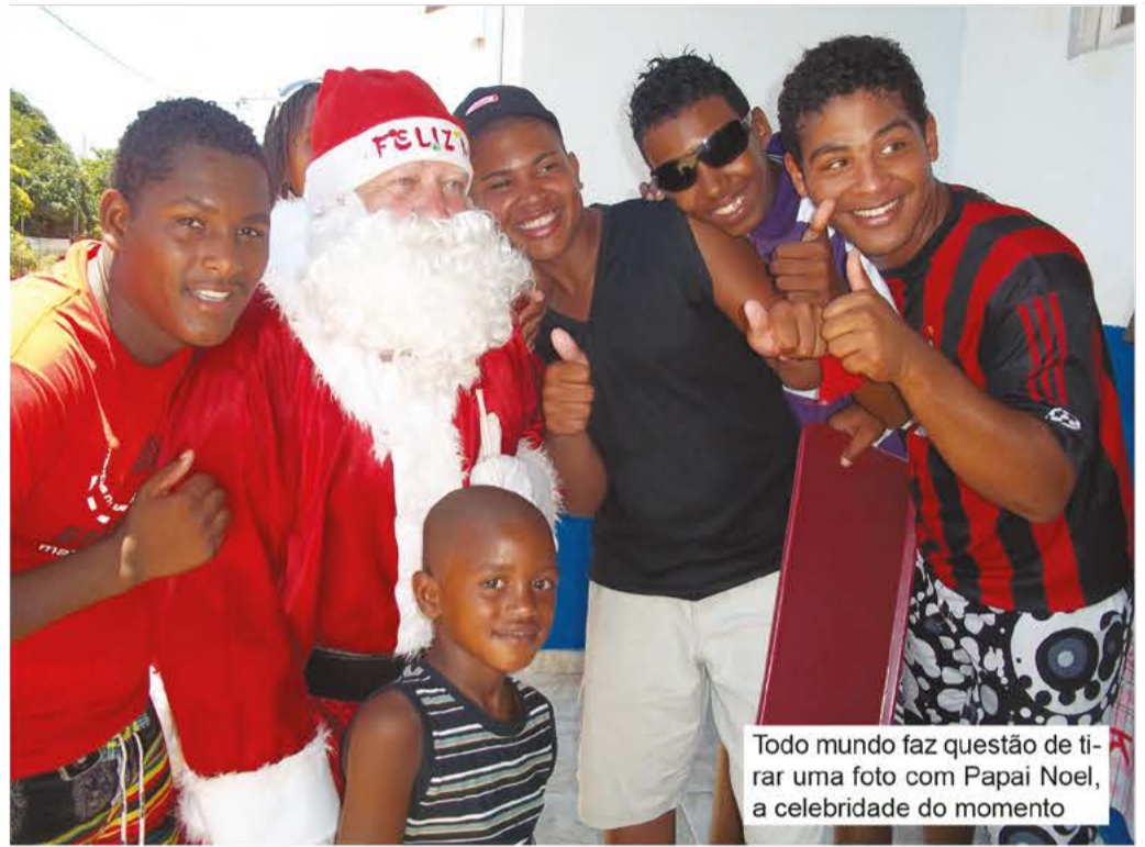
Todo mundo faz questão de tirar uma foto com Papai Noel, a celebridade do momento