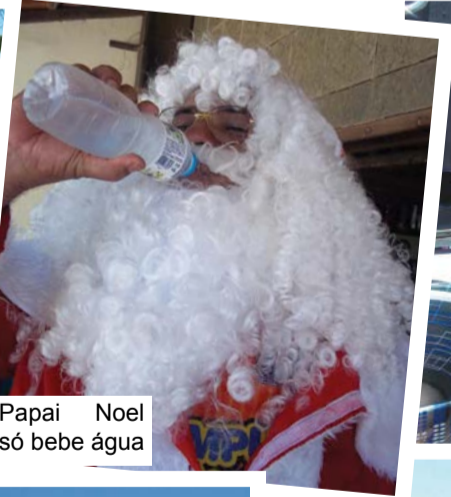
Papai Noel só bebe água