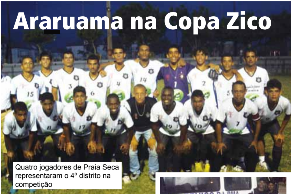
Quatro jogadores de Praia Seca representaram o 4º distrito na competição