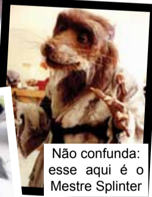
Não confunda: esse aqui é o Mestre Splinter

Cachorro bom é assim: tem que ter sócia no cinema pra tirar onda