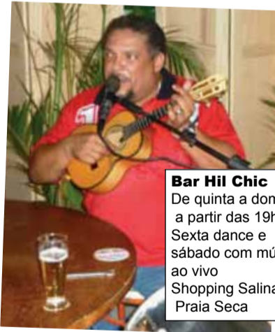
Bar Hil Chic De quinta a domingo a partir das 19h Sexta dance e sábado com música ao vivo Shopping Salinas – Praia Seca