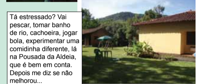
Tá estressado? Vai pescar, tomar banho de rio, cachoeira, jogar bola, experimentar uma comidinha diferente, lá na Pousada da Aldeia, que é bem em conta. Depois me diz se não melhorou...