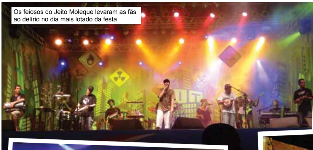
Os feiosos do Jeito Moleque levaram as fãs ao delírio no dia mais lotado da festa