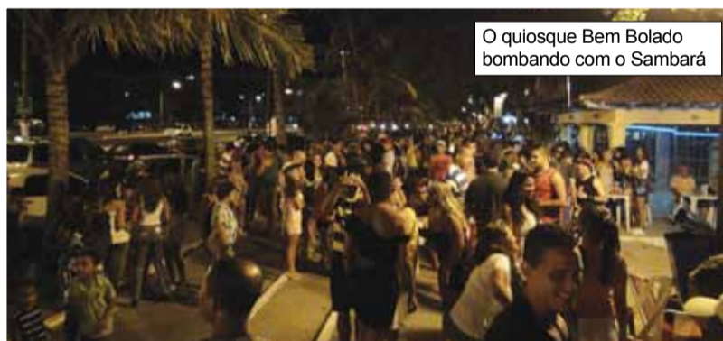
O quiosque Bem Bolado bombando com o Sambará