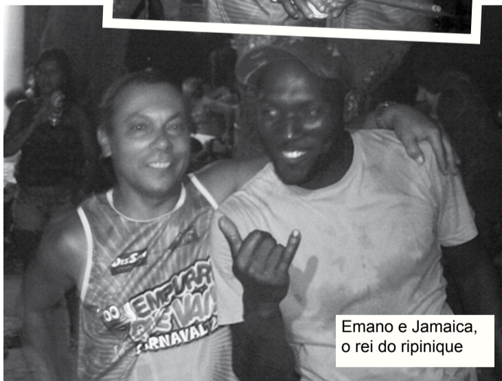
Emano e Jamaica, o rei do ripinique