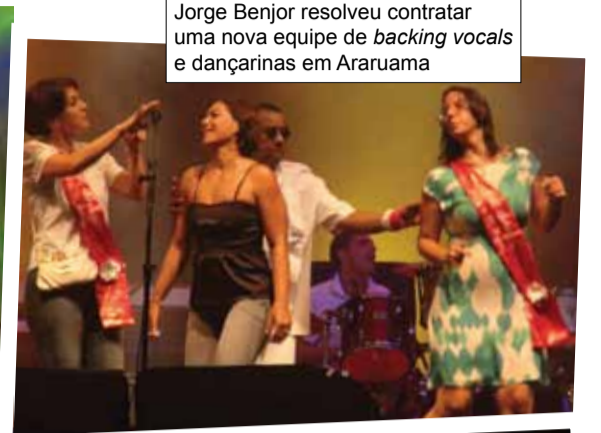
Jorge Benjor resolveu contratar uma nova equipe de backing vocals e dançarinas em Araruama