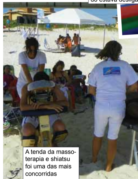
A tenda da massoterapia e shiatsu foi uma das mais concorridas