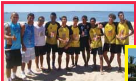
Futebol Americano Região dos Lagos Hammerheads, de Araruama

Como parte das comemorações pelos 152 anos de Araruama, no dia 6 de fevereiro aconteceram as finais do Circuito Lagoa Mar Sport na Praia do Centro. Além das disputas do futevôlei, futebol de areia, vôlei e futebol americano, aconteceu a etapa do Campeonato Regional de Canoa Havaiana. O secretário de Esportes e Lazer Peu comandou a festa.