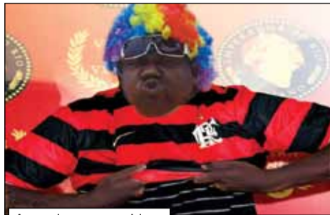
A camisa num cabia di geitu ninhum. Perdi o negóço aqui...