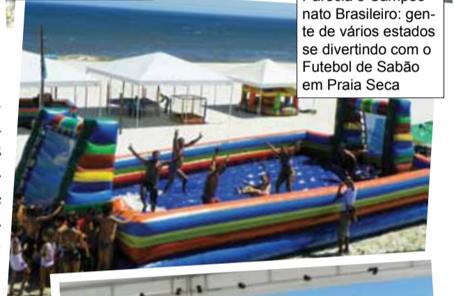
Parecia o Campeonato Brasileiro: gente de vários estados se divertindo com o Futebol de Sabão em Praia Seca