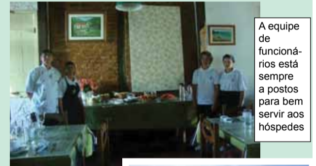
A equipe de funcionários está sempre a postos para bem servir aos hóspedes