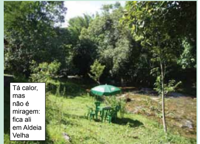
Tá calor, mas não é miragem: fica ali em Aldeia Velha